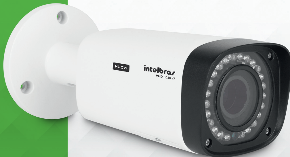
Câmera HDCVI varifocal com infravermelho