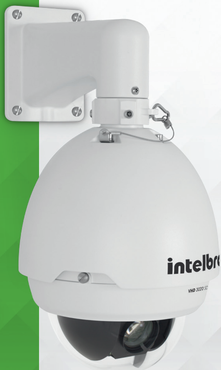
Câmera HDCVI speed dome